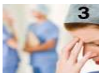
Тип 3: работник-на-работник