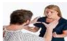
Тип 2: потрошувач/клиент